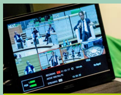
Seite 20: Dresdner Gesprächskreis thematisiert Bedeutung der Meinungsfreiheit