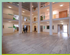
Seite 22: Travertinfußboden im Altbaufoyer erzählt von Bauhaus-Epoche