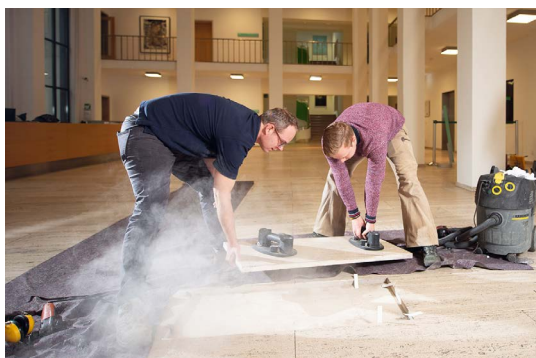
// Entnahme einer Platte

Es traf sich, dass just im Januar 1930 die Weltausstellung in Barcelona endete. Auf der Exposition, die sich in ihrem Programm mit Industrie, Sport und auch Kunst befasste, war einer der gefeierten Länderpavillons der Beitrag der Weimarer Republik. Der damals dreiundvierzigjährige Architekt Ludwig Mies van der Rohe hatte mit